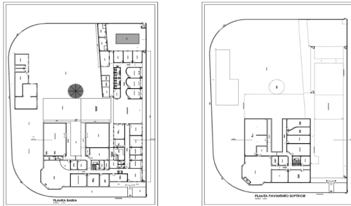
Planta baixa da sede da FSDOWN. (2024)

Os atendimentos promovidos pela FSDown acontecem em sede própria, que conforme plantas acima, localiza-se em um prédio com dois andares. A ligação entre esses andares acontece tanto por escadas quanto por elevador com acessibilidade. O prédio conta com 14 (catorze) banheiros, sendo 1 com acessibilidade, 1 auditório para cerca de 100 pessoas, 1 anfiteatro com capacidade para 40 (quarenta) pessoas, 4 (quatro) salas para atendimentos individuais e que permitem sigilo, 1 sala para atendimento fisioterapêutico, 1 sala para atendimento de bebês e crianças na primeira infância, 2 salas de atendimento em